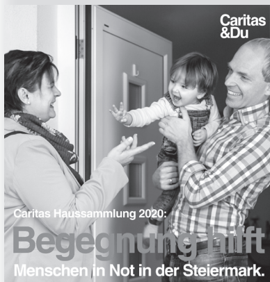
Caritas Haussammlung 2020:

Begegnung hilft Menschen in Not in der Steiermark.