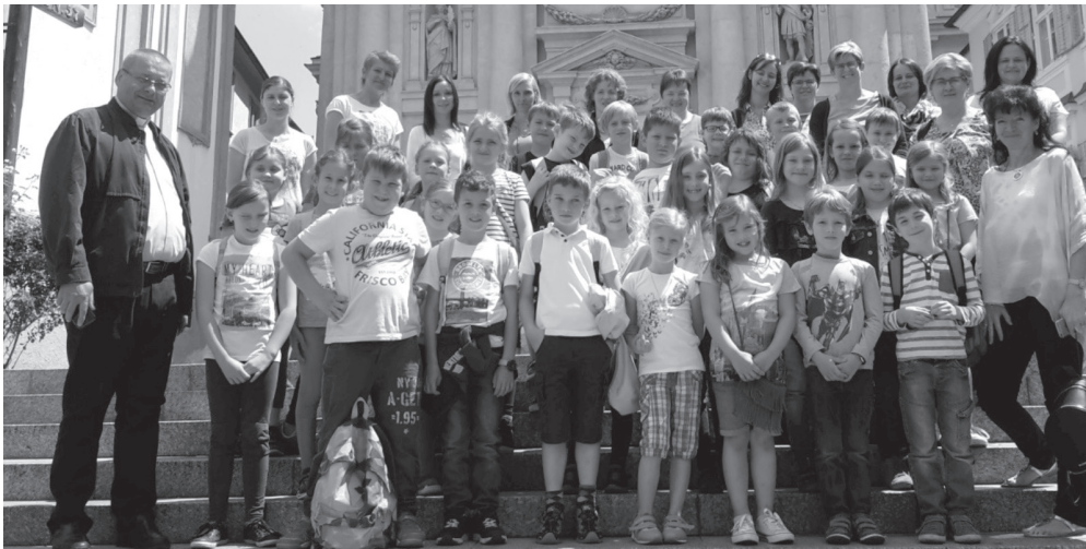
(Die Kinder der 2. Klasse VS)