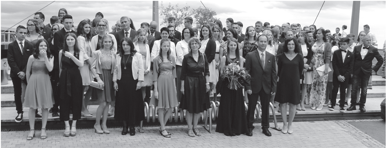
Unsere Firmlinge 2020

Am Samstag, 14. Juli 2020 wurde die Firmung in St. Anna nachgeholt.