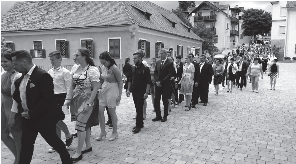
Einzug der Firmlinge