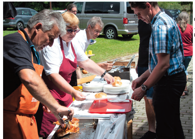
Grillhendl - schon Tradition