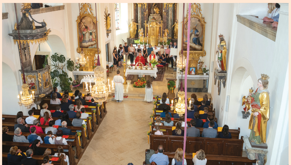
Feier der Firmung