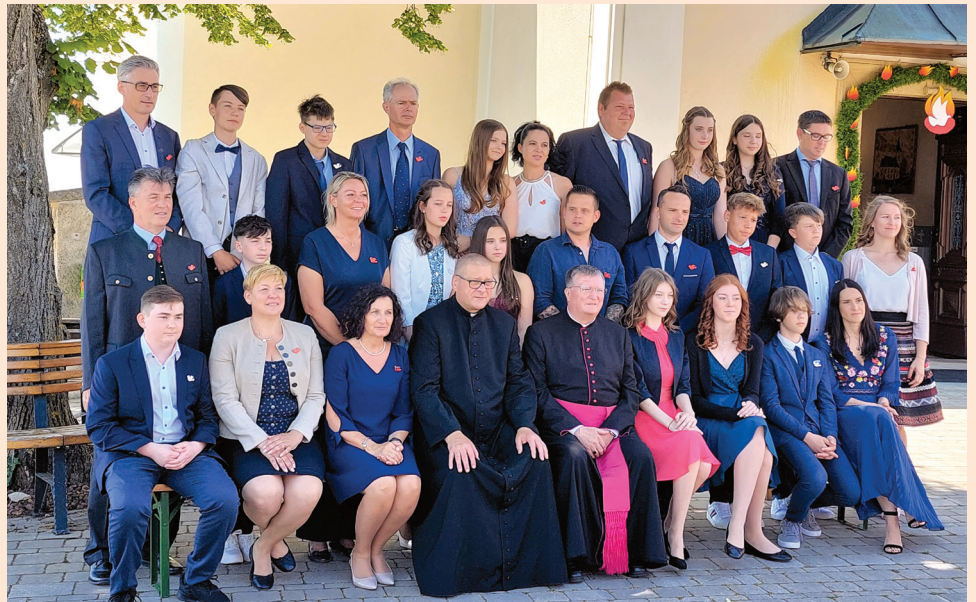
Firmlinge mit Firmspender und Paten